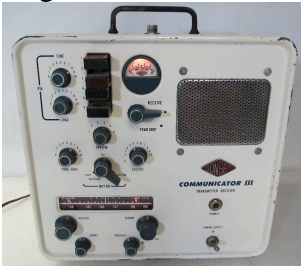
Gonset Communicator III