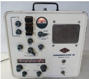
Gonset Communicator III

Zum Empfang verwendete man zumeist eine gewöhnliche Audionschaltung (als Geradeausempfänger) mit kapazitiv veränderbarer Rückkopplung und normalen Empfängerröhren. Nachstehend ist eine Schaltung aus dem Buch „Sende-Praktikum für KW-Amateure“ von 1935 abgedruckt. Sendemäßig wurden ganz normale Schwingungsschaltungen als Dreipunkt Anordnungen oder (besser) im Gegentakt mit üblichen Verstärkerröhren, z.B. RE 134/RE 504 benutzt. Über Einzelheiten wird auf den nachfolgenden Seiten über 5m- Sender berichtet. Als Sendeantennen wurden vertikale Dipole oder ein in Oberwellen erregter Draht über abgestimmte Parallelleitungen verwendet. Zur Frequenzmessung diente das Lechersystem - Koaxialkabel und Yagi Antennen waren noch nicht bekannt.