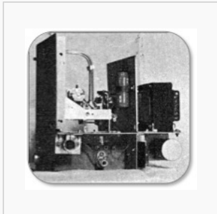
Wallmann Konverter Seitenansicht