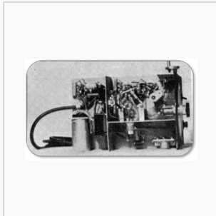
Ansicht von unten