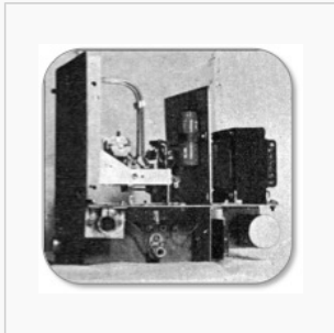
Wallmann Konverter Seitenansicht