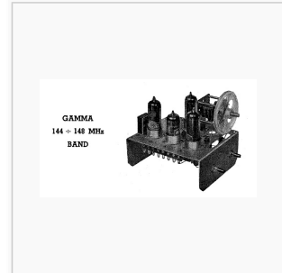
Baukosten laut Verfasser DM 39,70: 2 Röhren DM12,00, Trafo DM 5,00

2-m-Transceiver (Handfunksprechgerät) aus CQ 10/1949 von Bernd Cramer, DL3XC