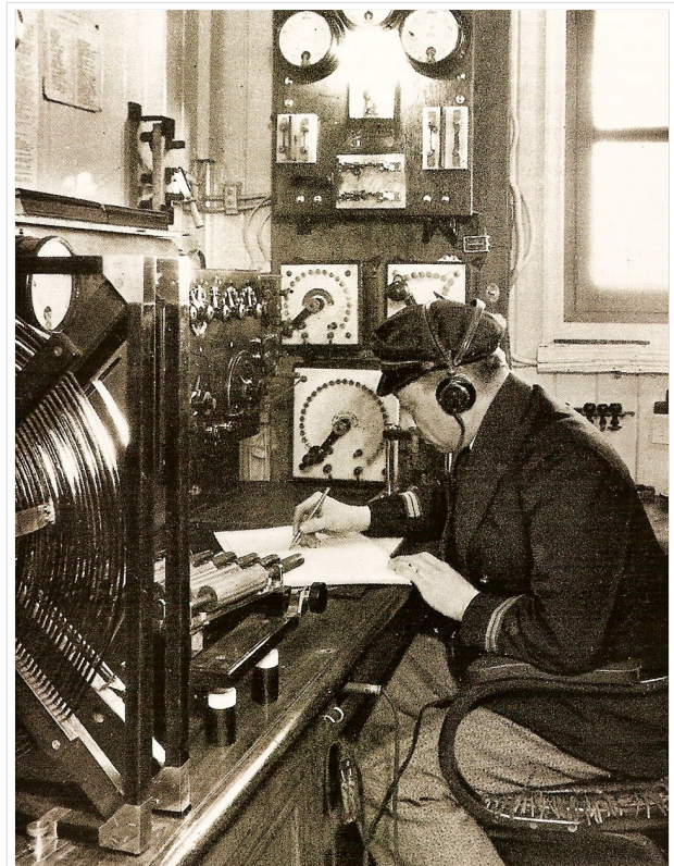
Funkraum eines Frachters ca. 1922