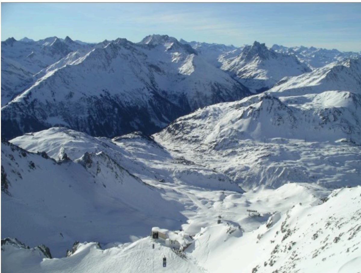
Ausblick von der Valluga

Das Amateurfunkfernsehen Relais OE7XVR (zuvor OE7XSI) befand sich auf der Valluga in JN57CD, einem 2809m hohen Berg in den westlichen Lechtaler Alpen, zugleich der höchste Gipfel im Arlberggebiet entlang der Grenze zwischen den österreichischen Bundesländern Tirol und Vorarlberg. Die Valluga liegt inmitten des einzigartigen Wintersportgebiets Arlberg. Dieses ATV-Relais nahm seinen Betrieb im September 2004 auf, im Mai 2009 erfolgte die Rufzeichenänderung des Valluga-Umsetzers von OE7XSI zu OE7XVR.