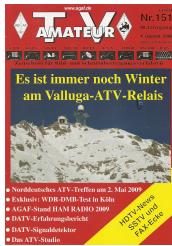
Titelbild: Ausgabe 151