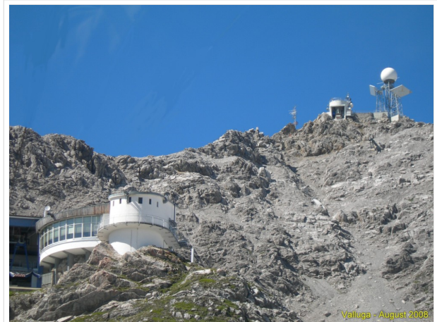
Valluga im Sommer